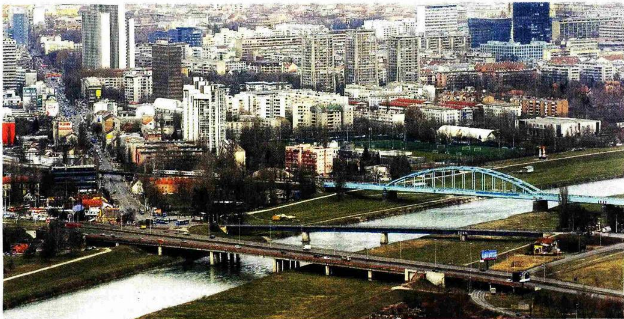
Gradani žele da Sava i dalje bude mjesto za rekreaciju